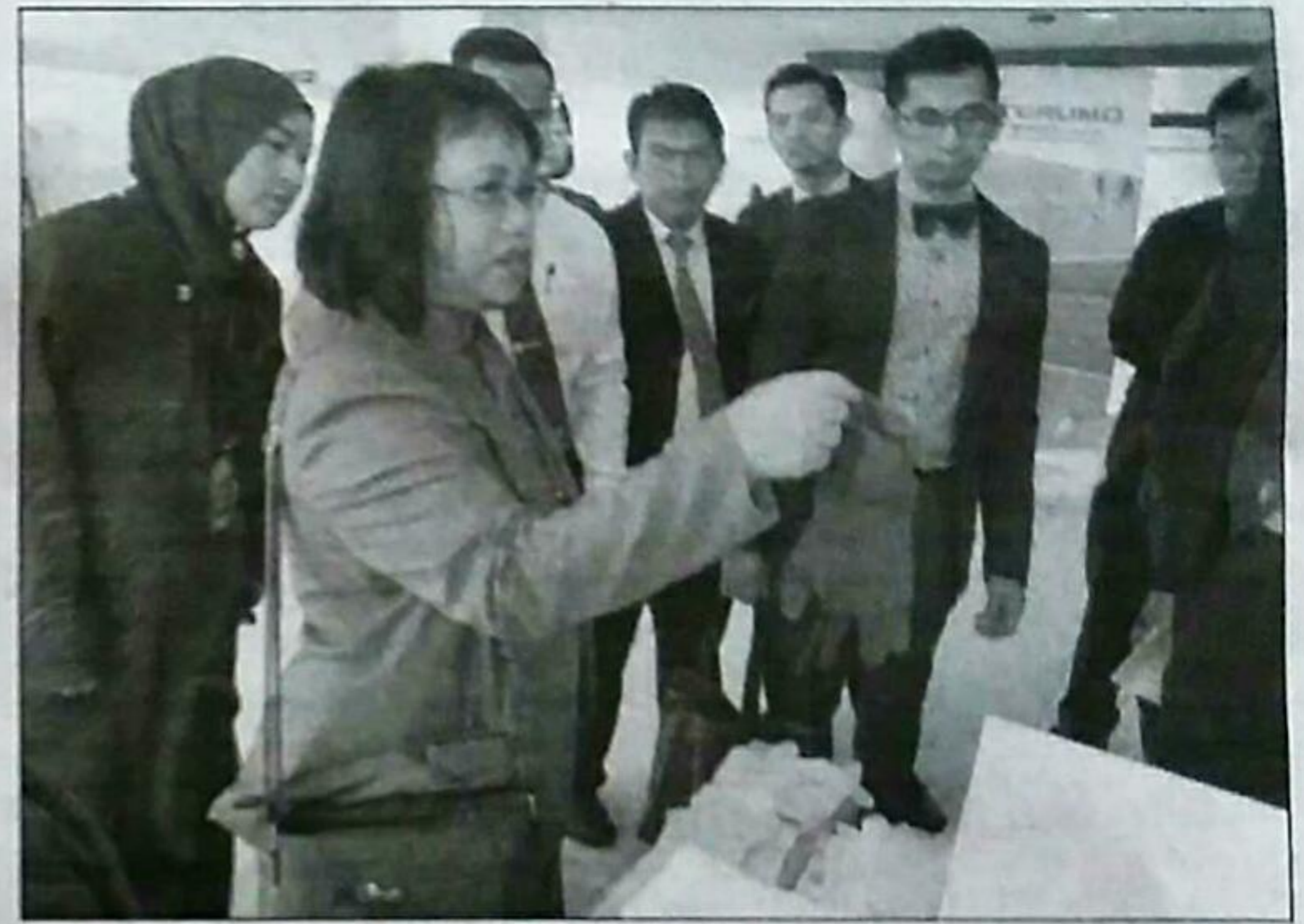
PERLINDUNGAN ... Penggunaan sarung tangan antara aspek kebersihan dan perlindungan yang perlu diberi penekanan kalangan petugas di bawah kementerian kesihatan.